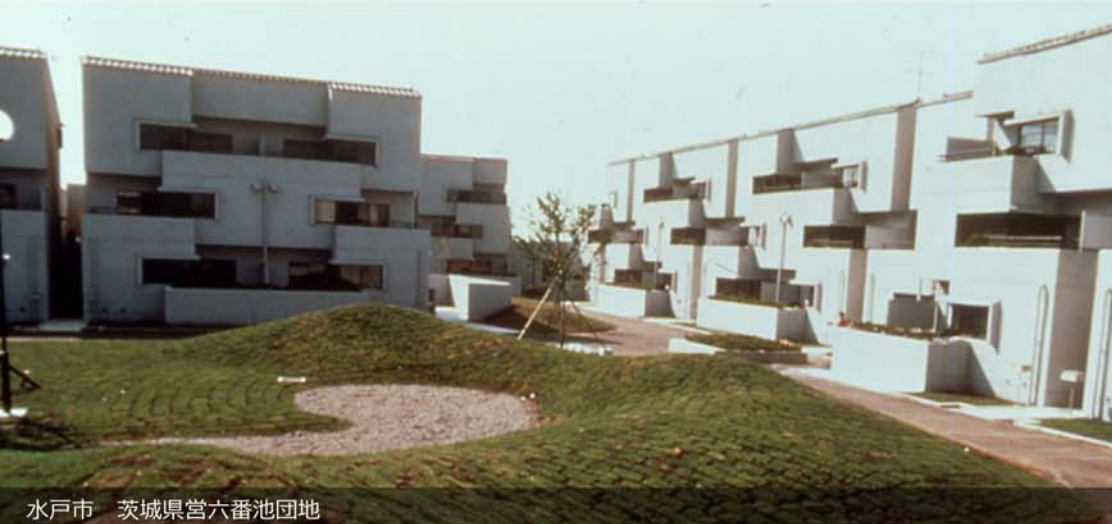
水戸市 茨城県営六番池団地