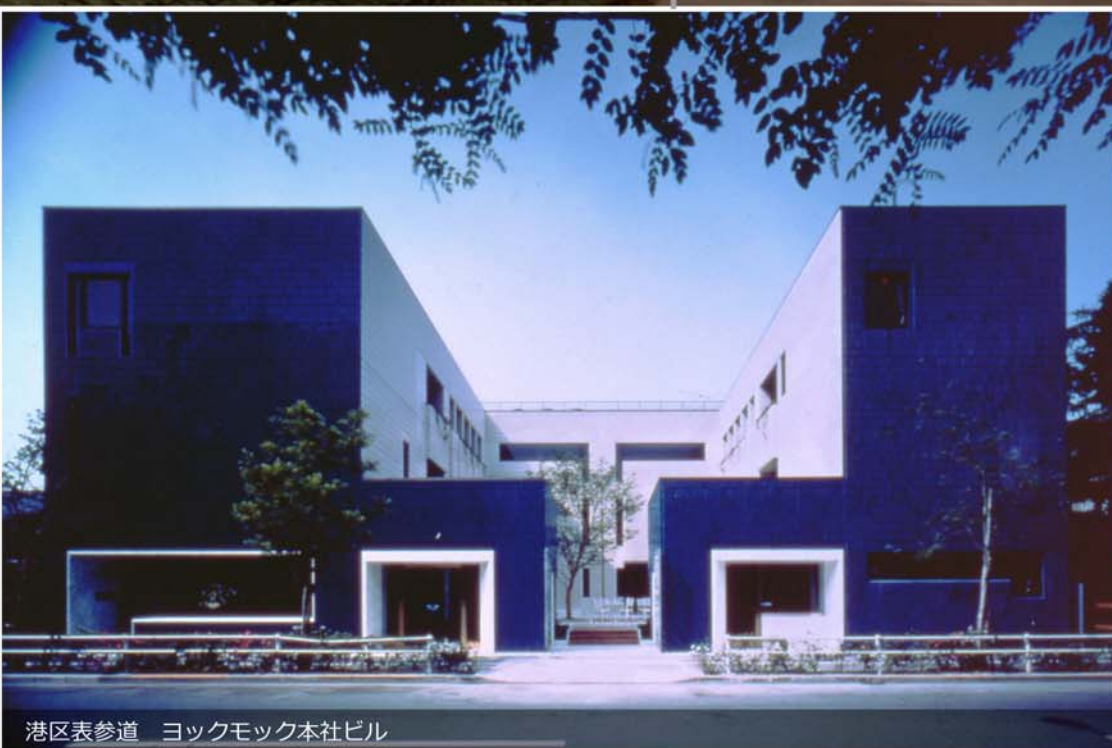
港区表参道 ヨックモック本社ビル