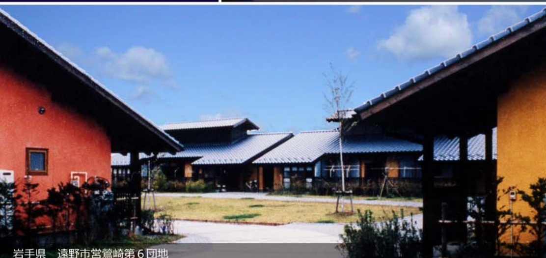
岩手県 遠野市宮崎第6団地